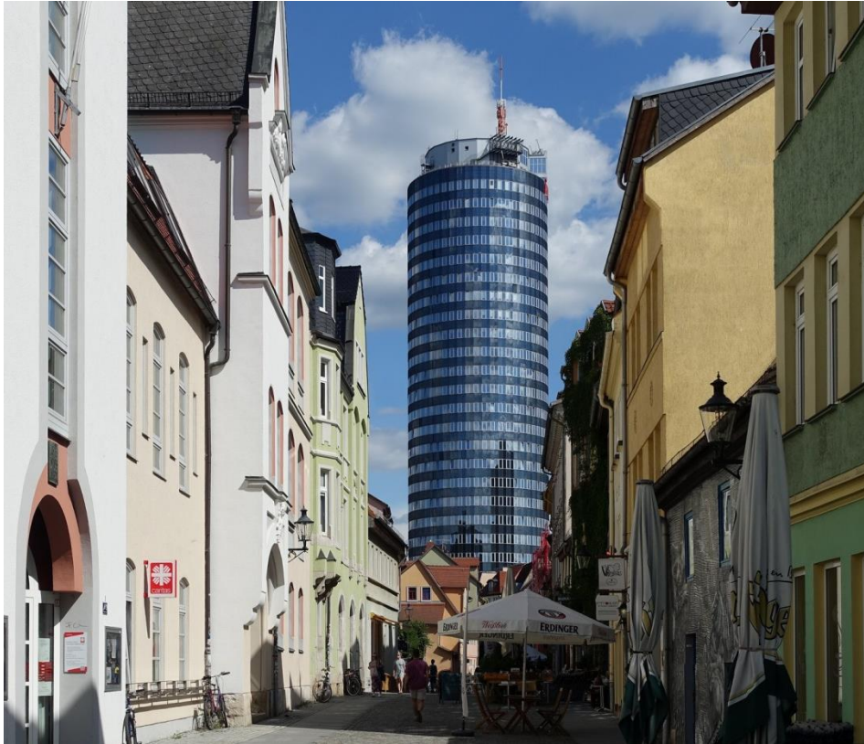
Bild links: Der zylindrische Bau des Uni-Turms überragt die feingliedrige, schmucke Jenaer Altstadt um ein Mehrfaches.

Die thüringische Stadt Jena hat kaum einer auf dem Zettel, wenn es um Hochhäuser geht. Dabei haben die Bauten in der Stadt die Liste der höchsten Gebäude in Deutschland nicht nur einmal angeführt.